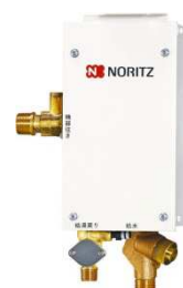
即出湯ユニット QU-4 15A 55,000 円(税別)