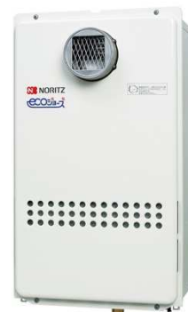
高効率 16 号業務用 ガス給湯器 GQ-C1634WZ-C 【屋外壁掛形】