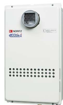
高効率 16 号業務用 ガス給湯器 GQ-C1634WZ-C 【屋外壁掛形】