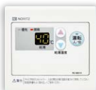
サブリモコン RC-8001A(非防水形) ¥14,300(税抜¥13,000)