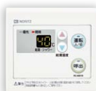
浴室サブリモコン RC-8001B(防水形) ¥18,370(税抜¥16,700)

〈別売〉 浴室用屋外カバーセット ¥1,430(税抜¥1,300) 0700757