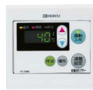
浴室リモコン RC-7606S ¥12,430(税抜¥11,300)