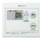
浴室サブリモコン RC-8001B(防水形) ¥17,270(税抜¥15,700)