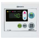
浴室リモコン RC-7606S ¥12,430(税抜¥11,300)