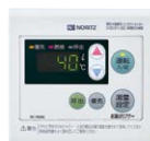
浴室リモコン RC-7606S ¥13,200(税抜¥12,000)