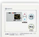
浴室サブリモコン RC-8001B(防水形) ¥18,370(税抜¥16,700)

〈別売〉 浴室用屋外カバーセット ¥1,430(税抜¥1,300) 0700757