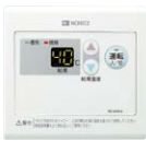
サブリモコン RC-8001A(非防水形) ¥13,420(税抜¥12,200)