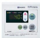
浴室リモコン RC-7606S ¥13,200(税抜¥12,000)