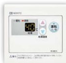
サブリモコン RC-8001A(非防水形) ¥14,300(税抜¥13,000)