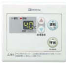
浴室サブリモコン RC-8001B(防水形) ¥17,270(税抜¥15,700)