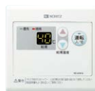
サブリモコン RC-8001A(非防水形) ¥13,420(税抜¥12,200)