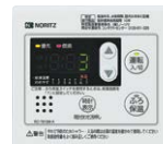
台所リモコン RC-7613M-A(T) (本体脱着式)