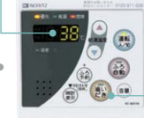
台所リモコン RC-8201M(T) (本体脱着式)