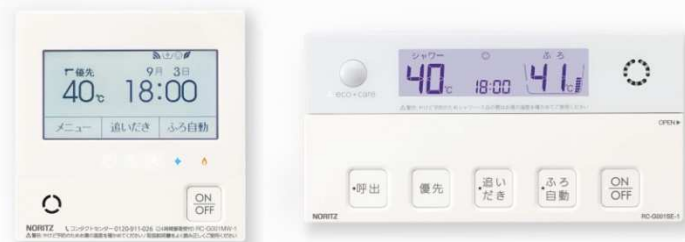
写真は RC-G001EW-1 マルチセット 左:台所リモコン 右:浴室リモコン

対象製品: 無線 LAN 対応給湯器リモコン 「RC-G001(P)EW-1」、「RC-G057PEW」