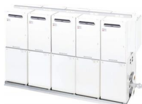
大規模施設用マルチシステム