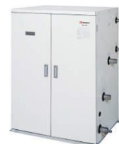
温浴施設用ろ過ユニット