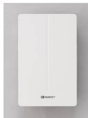
遠隔通信ユニット NAU-2-LAN

また遠隔監視システムの対象機器をろ過ユニット、24～16号の小規模施設用小型給湯器、業務用ふろ給湯器などまで拡大し、業務用市場での保守事業の取り組みを本格化させます。ノーリツはお湯のプロとして、機器の提案、設計、施工から管理、そしてアフターサービスまで、一貫して業務用機器をサポートいたします。