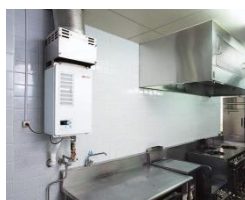
小規模施設用小型給湯器