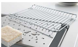
焼き網はフラットで洗いやすく