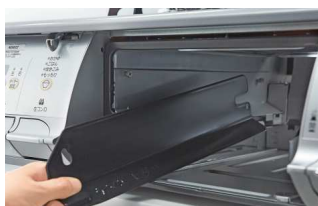
取り外し可能なグリルサイドカバー