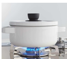
バーナーから鍋を離すと

新商品では、お客さまに安心してご使用いただくための安心機能を充実させました。鍋なし検知機能は、鍋を置かないと点火せず、また点火している状態でバーナーから鍋を離すと自動的に弱火になり、1分後に自動消火する機能です。調理時に衣服の袖口などに炎が着火するなどの危険性を軽減します。