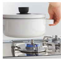
自動的に弱火になり