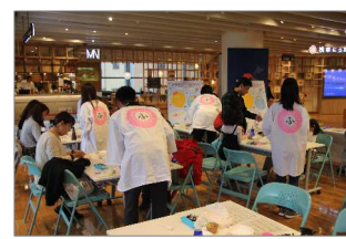
おふろ部外部活動

※：専門指導は東名阪で実施予定。受講料は無料、会場までの交通費は参加者が実費負担