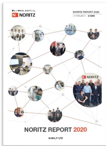
【ノーリツレポート 2020 表紙】

当社グループは「社会的価値」「経済的価値」「ブランド価値」の3つの価値を高め、それぞれを融合させていくことで、ミッション「新しい幸せを、わかすこと。」の実現を目指しています。本レポートやホームページの公開情報を、ステークホルダーとの対話ツールとして活用することで、経営の基盤を堅固なものとし、社会から必要とされ続ける企業を目指して取り組んでまいります。