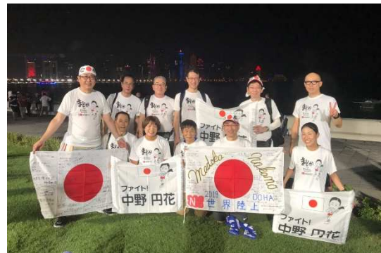
現地ドーハへ応援に駆けつけた応援団