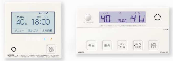
「RC-G001EW」左：台所リモコン、右：浴室リモコン

2018年9月発売のリモコン「RC-G001EW」は、入浴時の安心をサポートする「見まもり」機能を業界で初めて搭載した高効率ガスふろ給湯器「GT-C62 シリーズ」、および同機能を搭載した高効率ガス温水暖房付ふろ給湯器「GTH-C シリーズ」向けで、スマートフォンを使ってリビングなど宅内からの入浴者の「見まもり」が可能のほか、外出先からの「お湯はり」、「温水暖房」などの操作ができます。今回の新システムにより、スマートスピーカーを介して音声での操作も可能となりました。