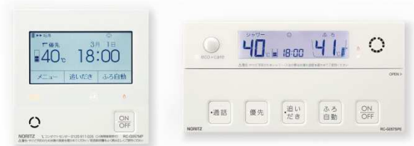
「RC-G057PEW」左：台所リモコン、右：浴室リモコン

対応リモコンの追加発売に関しては、環境・省エネルギーと快適性を両立したハイブリッド給湯・暖房システム「ユコア HYBRID」用の無線 LAN 対応新リモコン「RC-G057PEW」を3月1日に発売します。こちらも、リビングなど宅内からの入浴者の「見まもり」がスマートフォンで可能なほか、外出先からの「お湯はり」、「温水暖房」などの操作がスマートフォンでできます。今回の新システムにより、スマートスピーカーを介して音声での操作も可能となりました。