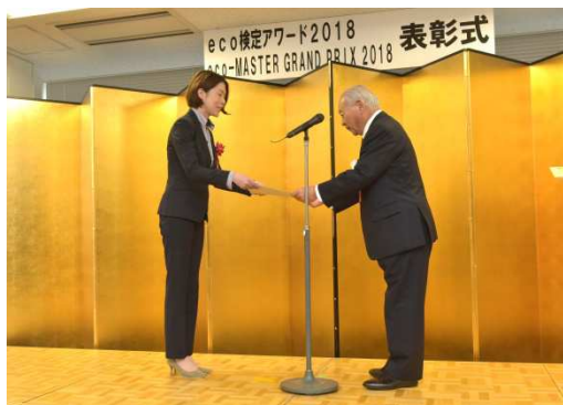
eco 検定アワード 2018 表彰式の様子 (2018年10月26日)

当社は環境省認定の「エコ・ファースト企業」として、社員の環境に関する意識と知識向上を図り、持続可能な社会づくりに貢献します。