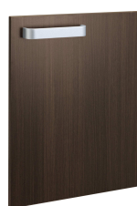
ブリティッシュオーク (新色)