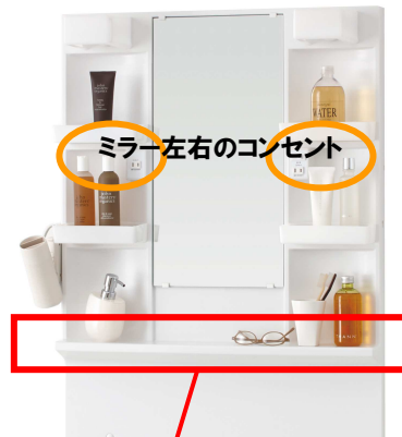
ミラー左右のコンセント

1面鏡ミラーキャビネットは、洗面所での使い勝手を考えた機能を搭載しています。ミラー下に設けた、奥行き約9cm(センター部)のフラットな仮置き棚は、化粧品や整髪用品などを一時的に置くスペースとして活用いただけます。また、ドライヤー・電動歯ブラシなど使用頻度の高い電化製品が同時使用できるよう、ミラー左右に1カ所ずつの計2カ所、ダブルコンセントを設置しています。