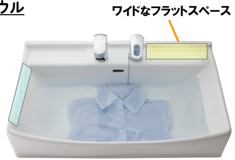
ワイドなフラットスペース

高級感ある陶器製のボウルは、フランジ(へり)が薄いスクエア形状でスタイリッシュなデザインです。満水時は17リットルの大容量で、毎日の洗面使用時はもちろん、洗濯、掃除と、水仕事全般に使える親切設計です。水栓の両サイドには、石鹸やハンドソープなどを安定した状態で置けるフラットスペースを設けました。さらに、水栓取り付け部に緩やかな5度の傾斜を設け、水たまりができていないのでお手入れが簡単です。