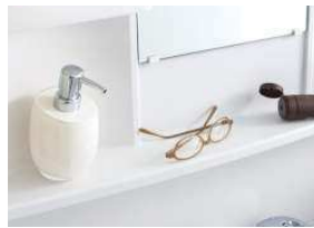
フラットな仮置き棚