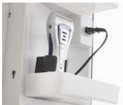
ミラー左右にダブルコンセント