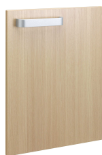
ノルディックオーク (新色)