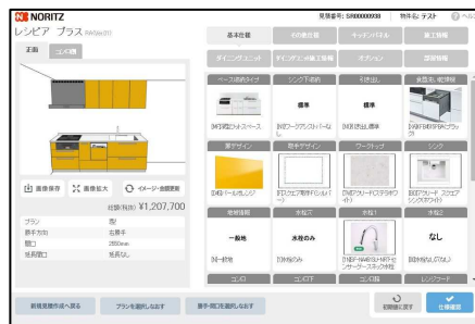
シミュレーション画面