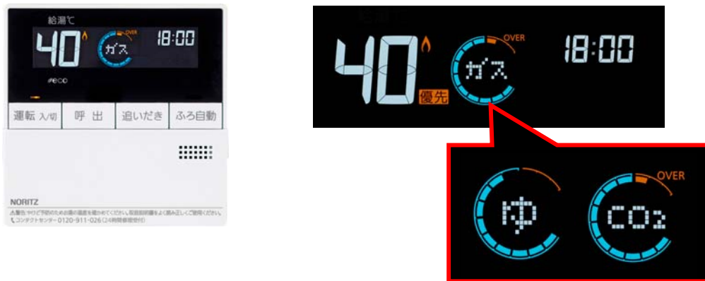
【台所リモコンのエネリング表示】