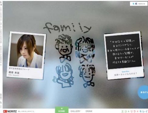
ノーリツ社員の「エコ*リラ*キレイ」への想い

「ファンづくり」では、ブランドスペシャルサイトでノーリツ社員の「エコ*リラ*キレイ」に託した想いを描き消費者へ伝え、消費者から消費者へ、「エコ*リラ*キレイ」の想いがバトンのようにリレーされるコンテンツを web 上で展開しています。社員だけではなく誰でも絵を描いたり人気投票ができ、twitter や facebook のアカウント取得者であれば絵の投稿が可能です。