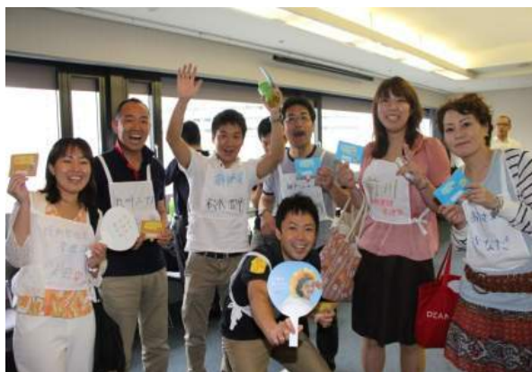
「幸せわかし隊」メンバー

また、社内公募にて有志を募り、各部署から集まった56人が「幸せわかし隊」として活動を始めました。目的は、ひとりひとりが生き活きと働き、まずは自分にできる「新しい幸せをわかす」とは何かを考え、社内外をわかす行動ができる人材を育成、風土づくりに取り組んでいます。