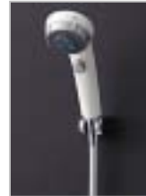
ワンストップシャワーヘッド

さらに、オプション機能の吐水・止水をワンタッチで出来る「ワンタッチ水栓」や「ワンストップシャワーヘッド」を採用することで、従来よりも 30% 節水することができます。