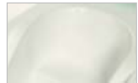
アナトミックフォルム