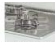
点火ボタンを押しても、スパーク点火が起きない。