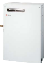
OX-4706YV | 059EB01