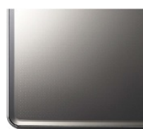
プラチナシルバー