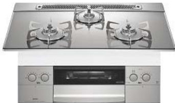
フェイス:ステンレス