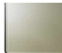
シャトルーズグリーン