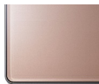
ピンクテラコッタ