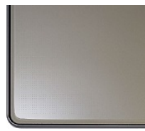
シャンパンクリア