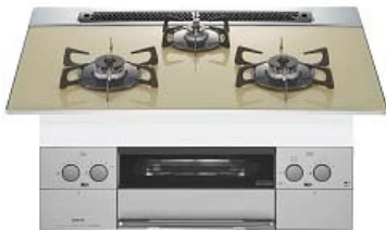
フェイス:樹脂パネルフェイス