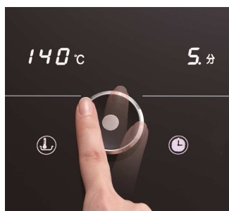
指先ひとつで簡単操作