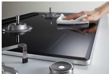
ごとくなどを外せば一気に汚れを拭き取れる