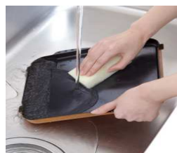
プレートは汚れが落ちやす いセラミックコーティング

マルチグリルは焼き網や受け皿がなく、洗いや ずいプレートで調理するので片付けが簡単です。 また庫内は側面にバーナーがなくフラットなので、 お手入れ性が向上しました。