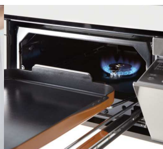
焼き網のない プレートを使ったマルチグリル