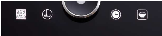
タッチスイッチ(左コンロ)