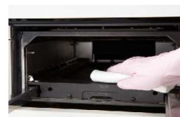
庫内側面はフラットな形 状でお手入れ性が向上