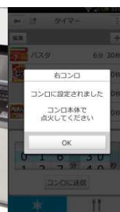
スマートフォン 連動機能