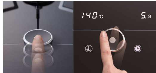
前方へスライドさせて点火 回して火力調節や温度設定