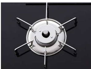
ステンレス製のごとくとバーナーリング