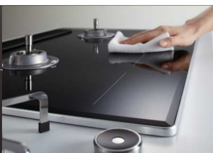
取り外せる点火スイッチと スタイリッシュなデザイン