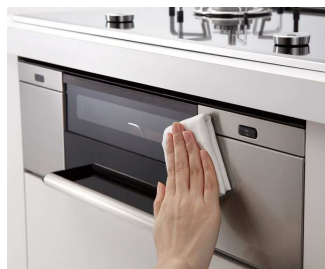
凹凸のないフラットなフェイス