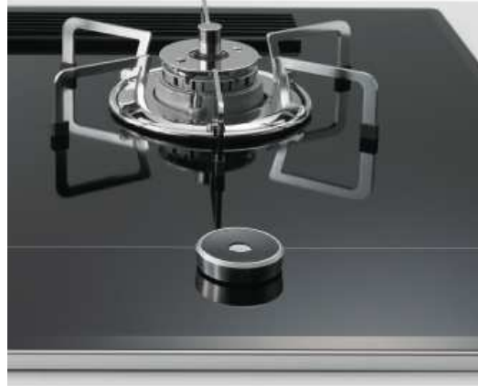
軽やかでスマートな操作感のツイストスイッチ

※ツイストスイッチとタッチスイッチは、EGO グループ内ドイツ法人”E.G.O. Elektro-Gerätebau GmbH”の技術を使用しています。