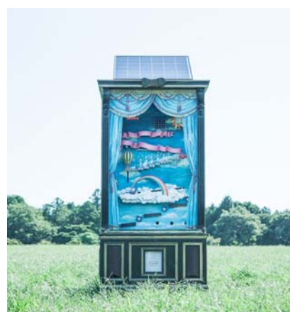
『太陽光のカラクリ箱』

TVCMでは「太陽光ができることってなんだろう?」という問いかけから、太陽光発電を皮切りに、風や雲や雨、そして緑が生まれていく様子を表現する中で「太陽光を何に変えようプロジェクト」の宣言を行います。また、CM内では太陽光から電気と熱をつくることのできるノーリツの製品「ダブルソーラー」も紹介します。