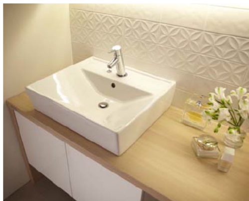
陶器製スクエアボウル