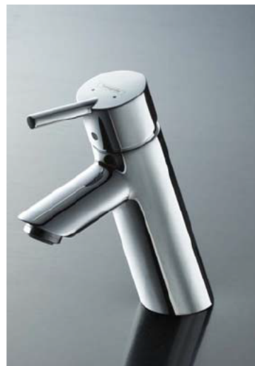
ハンズグローエ社製 シングルレバー水栓