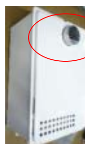
壁掛タイプ PS標準設置タイプ