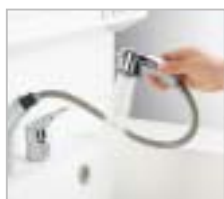
シングルレバーシャワー水栓

また、扉のカラーにはスタンダード4色と、システムキッチン「エスタジオ」や「ベスト」の扉に合わせられる8色の計12色をラインナップ。落ち着いた色のある色がインテリアに自然に溶け込みます。また把手は「ライン把手」「スクエア把手」の2種類から選べます。