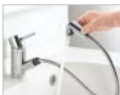
シングルレバー水栓