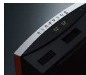
精巧なオーディオを彷彿させるLEDの光