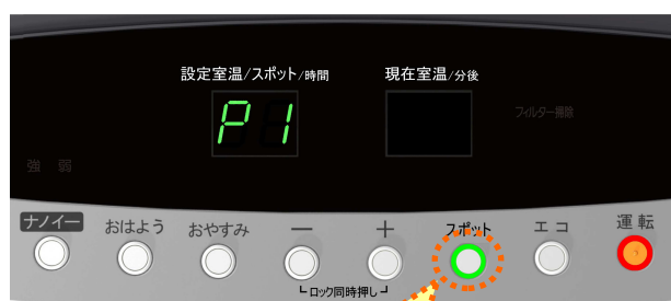
デラックスタイプ（操作部） 専用スイッチ

また、今回発売のスタンダードタイプにも、「スポット暖房機能」を新たに搭載しました。