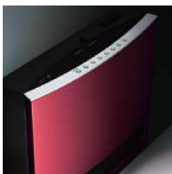
カラーステンレス フロントパネル