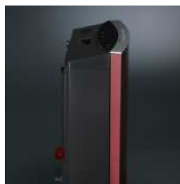
サイドから見ても美しいフォルム